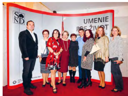
BALETNÝ GALAVEČER V SND