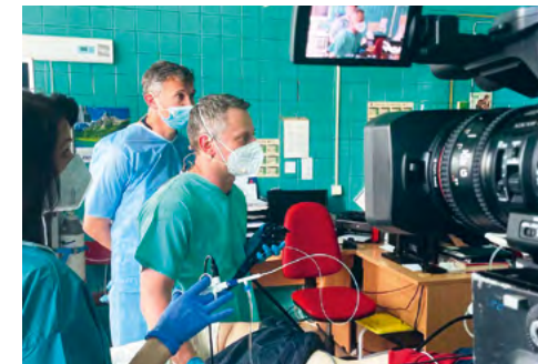
SLOVENSKÉ A ČESKÉ ENDOSKOPICKÉ DNI

a českých endoskopických dňoch. Na prestížnom dvojdnovom kongrese sa pod trenčianskym hradom stretlo až 300 špecialistov z Čiech a Slovenska. V prednáškovej sále sledovali živé komentované prenosy špecializovaných endoskopických výkonov z Fakultnej nemocnice v Trenčíne.