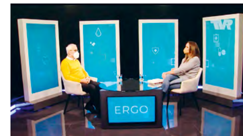
OSVETA O RAKOVINE KRČKA MATERNICE