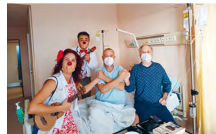
ZDRAVOTNÍ KLAUNI NA OKO G