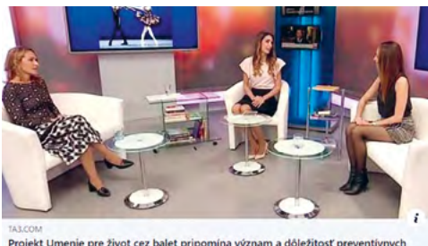
TA3.COM Projekt Umenie pre život cez balet pripomína význam a dôležitosť preventívnych