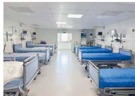
POLOHOVATEĽNÉ LÔŽKA NA OAIM

Na Oddelení onkohematológie I. (OOH I.) pribudol bezdrôtový ultrazvukový systém , ktorý sa používa na zobrazenie žily pri napichovaní PICC alebo CVK kátétrov. Oddelenie klinickej biochémie sa potešilo automatizovanému systému na stanovenie liečiv , ktorý sa používa najmä na stanovenie hladiny imunosupresív pre transplantovaných pacientov (cyklosporín). Rádiologické oddelenie disponuje novým mobilným RTG prístrojom s priamou digitalizáciou na diagnostické vyšetrenia. Na Rádiofyzike pribudli ožarovacie pomôcky , ktoré sa používajú na imobilizáciu pacienta počas liečby žiarením.