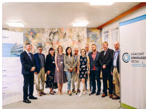
PRVÉ SYMPÓZIUM O RAKOVINE PLŮC