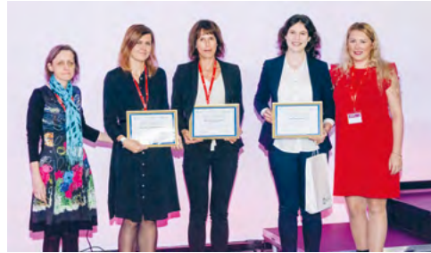
VÍŤAZKY GRANTU NOI