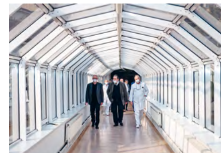
PODPÍSANIE MEMORANDA O SPOLUPRÁCI A PREHLIADKA NOÚ