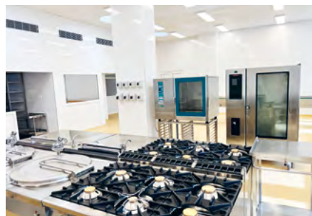
ZMODERNIZOVANÁ KUCHYŇA PRE PACIENTOV