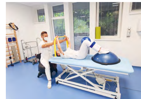
REHABILITAČNÉ LÔŽKO NA OFR

Tešíme sa, že na Oddelení fyziatrie, balneológie a liečebnej rehabilitácie (OFR) pribudli nové rehabilitačné lôžka , ktoré sa využívajú pri špeciálnych individuálnych cvičeniach s rehabilitačnými pomôckami a masážach. Ambulancia radiačnej onkológie a USG pracovisko na Oddelení radiačnej onkológie sa môže pochváliť novými vyšetrovacími lôžkami .