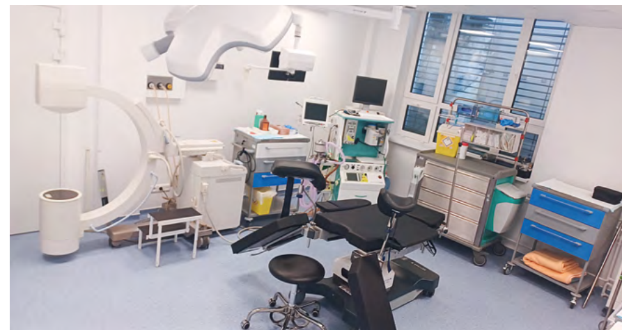
ZÁKROKOVÁ MIESTNOSŤ BRACHYTERAPIE

V polovici mája sme spustili prevádzku kompletne vynoveného pracoviska Brachyterapie v rámci Oddelenia radiačnej onkológie, kde sa ročne lieči približne 200 pacientov. Ide o formu rádioterapie, pri ktorej sa zdroj žiarenia umiestňuje pomocou špeciálnych aplikátorov do nádoru alebo do tesnej blízkosti nádoru, ktorý sa lieči. Vďaka rozsiahlej rekonštrukcii Brachyterapia rozšírila svoje priestory o novú ambulanciu, ožarovňu označenú číslom 5, čistiacu miestnosť a dve šatne pre pacientov. Pribudla tiež nová zákroková miestnosť s kompletným no-