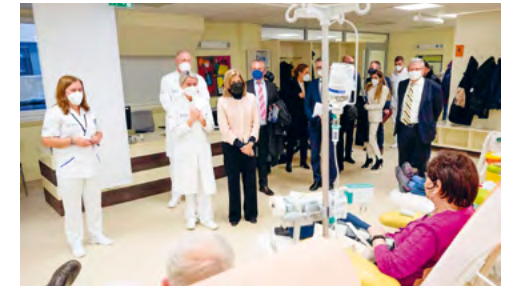
NÁVŠTEVA EUROKOMISÁRKY V NOÚ