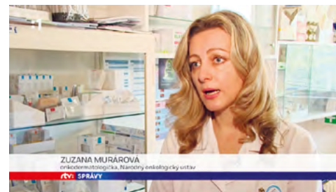
OSVETA O RAKOVINE KÔŽE