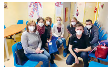
ZAMESTNANCI AKO DARCOVIA KRVI