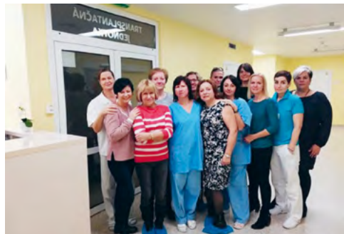
TÍM TJ NA KOH

u pacientov s nádorovými ochoreniami lymfatického systému. V jubilejnom roku 2022 sa v našom ústave podarilo vykonať rekordných 90 transplantácií. Transplantačný program sme obohatili o haploidentické alogénne transplantácie, kde sú darcami súrodenci, deti alebo rodičia pacienta. Srdčne gratulujeme celému tímu Transplantačnej jednotky na Klinike onkohematológie (TJ NA KOH).