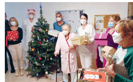
VIANOČNE DARČEKY PRE PACIENTOV