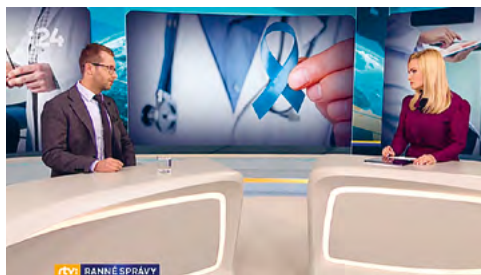
RTVS RANNÉ SPRÁVY